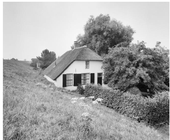
Rijksdienst voor het Cultureel Erfgoed 1999