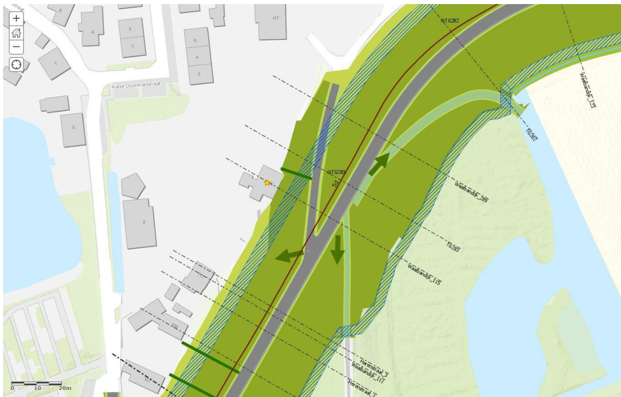
Profiel ter hoogte van Waalbandijk 115

Marginale afgraving van grondlichaam tegen pand voorzien. In UO eventuele lokale maatregelen ten aanzien van waterhuishouding om en nabij woning.