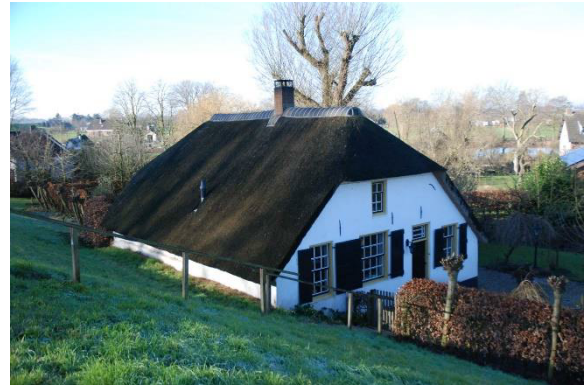
Graaf Reinald Alliantie

Omschrijving Boerderij (ca. 1800), even ten oosten van de dorpskom. Gepleisterd woongedeelte onder rieten wolfdak. Vensters met luiken en 18-, 9- en 6-ruitsschuiframes. Stal met overstek.