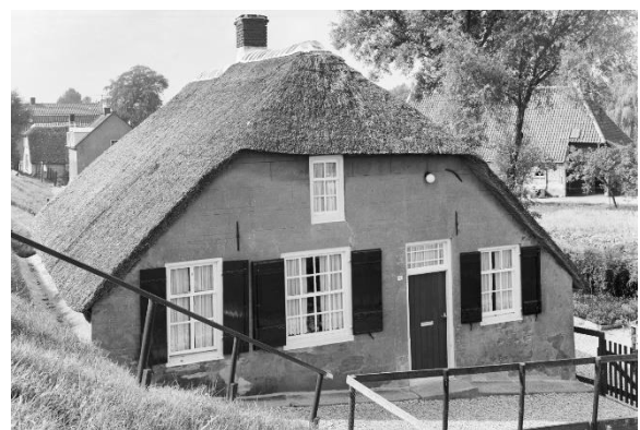
Rijksdienst voor het Cultureel Erfgoed, 1966